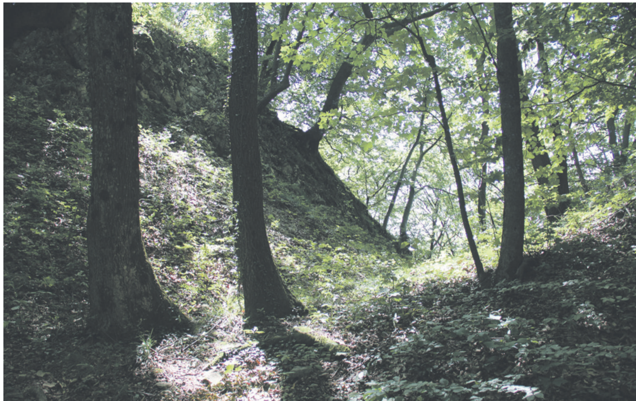
Überreste der Ruine Itkon (links) mit Halsgraben (rechts) nördlich der Ruine Bischofstein.